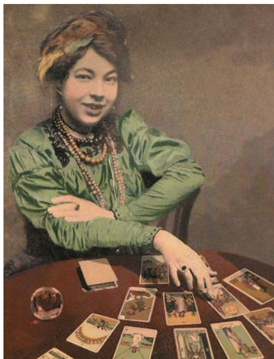
Pamela Colman Smith (geb. 1878 – overl. 1951)

Daarbij heeft hij Pamela Colman Smith (geb. 1878 – overl. 1951) ingehuurd om de tekeningen van het Rider-Waite deck te ontwerpen.